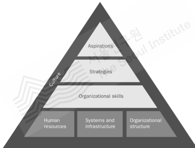
[그림 5-1] 비영리조직 역량 프레임워크

둘째, 가치 역량에 해당하는 내재적 신념, 가치, 정체성에 관한 요소들이 FGI에서는 개인 역량의 범주에서 주로 제기되고, 강조되어 논의되었다. 일반적으로 조직 역량 모델에서는 개인 역량은 사업 실행과 조직 목표 달성에 필요한 기술 능력에 치중해있으며, 가치 역량에 해당하는 요소는 조직 역량 프레임에서 가장 상위에 배치되어 있다.