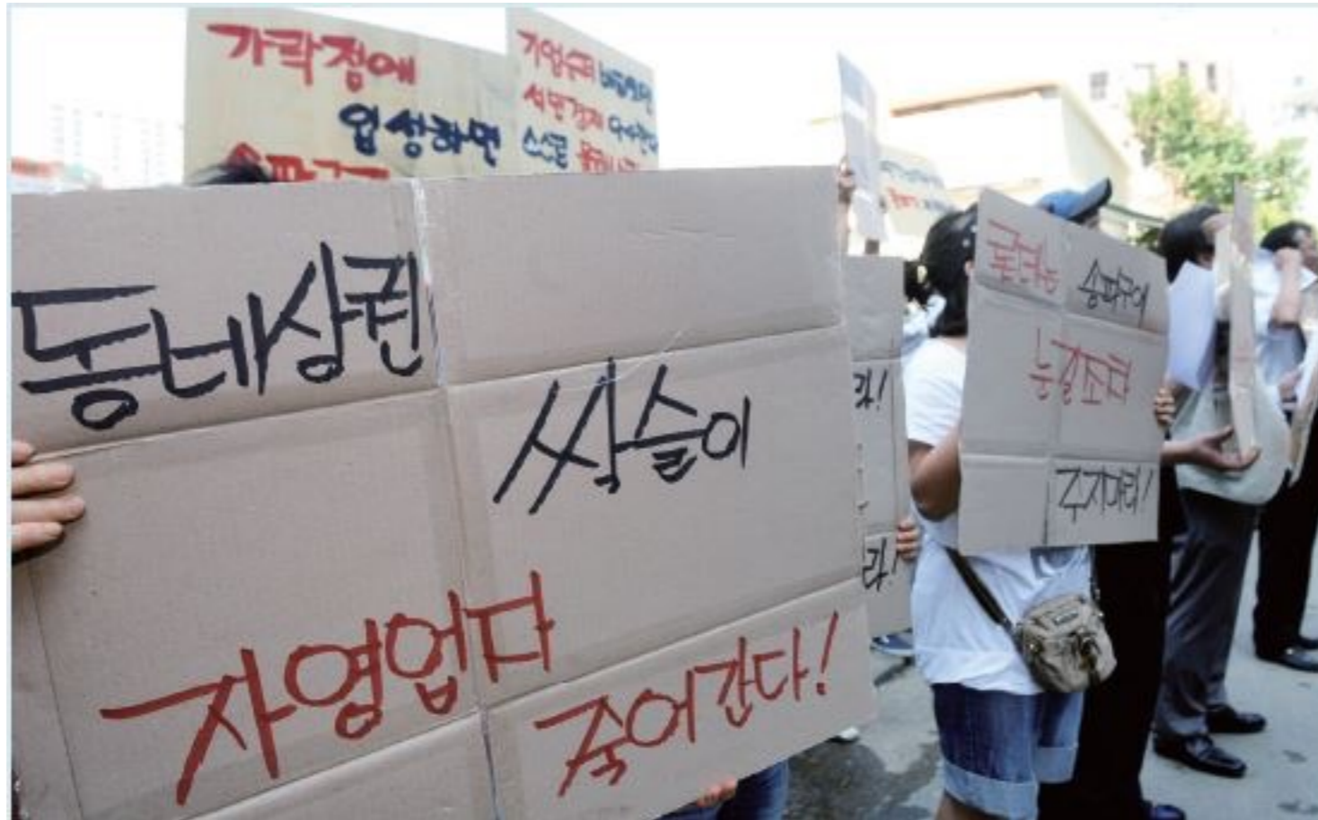
공동거주를 넘어 공동소유로