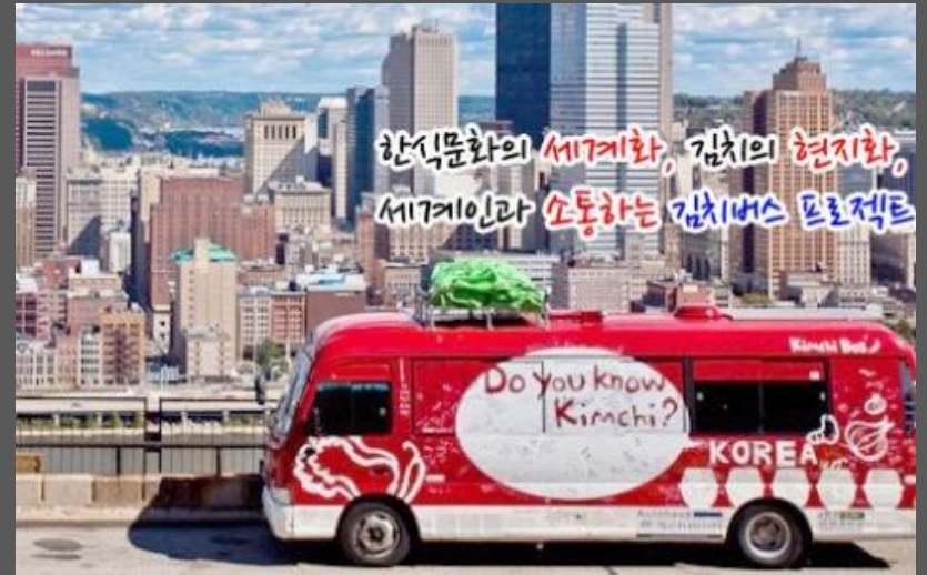
[김치버스 세계일주 프로젝트]

당신 안의 그 무엇, 그것이 브랜드다 "개인브랜드를 만들기 위해서는 내가 가장 잘하는 것이 무엇인지 알아야 하고 그것을 완성시키기 위한 훈련이 필요하며 세상과 소통하는 능력 또한 필요하다